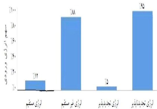
شکل ۲- سهم کل انرژی ورودی، به صورت انرژی مستقیم، غیر مستقیم،